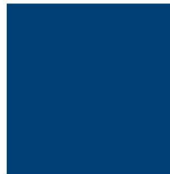
PANTONE 541 UP