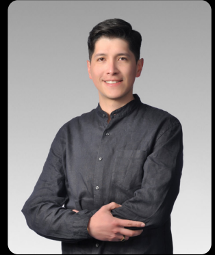
Darío Durán Sillerico Arquitectura